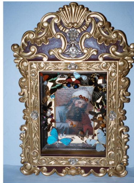
Heiliger JOACHIM, Gekrönter Siegelpatron des Heiligen Sacerdotiums, Wegbereiter der Erlösung der Menschheit