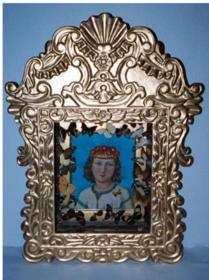
ADONAI-JESULEIN, Gekrönter Siegelpatron der Göttlichen Liebe, König der Engel und Wiedergutmacher der Sünden gegen Seine Göttliche Mutter und Braut