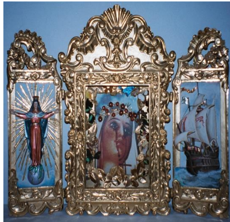
MARIA, Gekrönte Siegelpatronin der Heiligen Theologie, Miterlöserin und Kaiserin des Universums