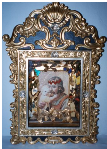
Heiliger JOSEPH, Gekrönter Siegelpatron des Heiligen Imperiums und Wegbereiter der Erlösung der Menschheit