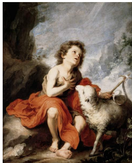
Heiliger JOHANNES, Wegbereiter der Erlösung der Menschheit