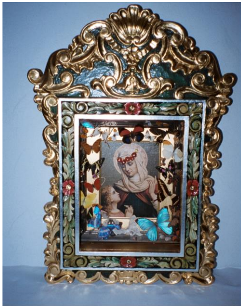
Heilige ANNA, Gekrönte Siegelpatronin der Heiligen Philosophie, Wegbereiterin der Erlösung der Menschheit