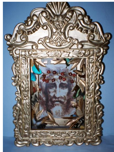
CHRISTUS, Gekrönter Siegelpatron der Göttlichen Wahrheit, Erlöser und König der Menschen