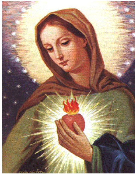
Unbeflecktes Herz Mariens