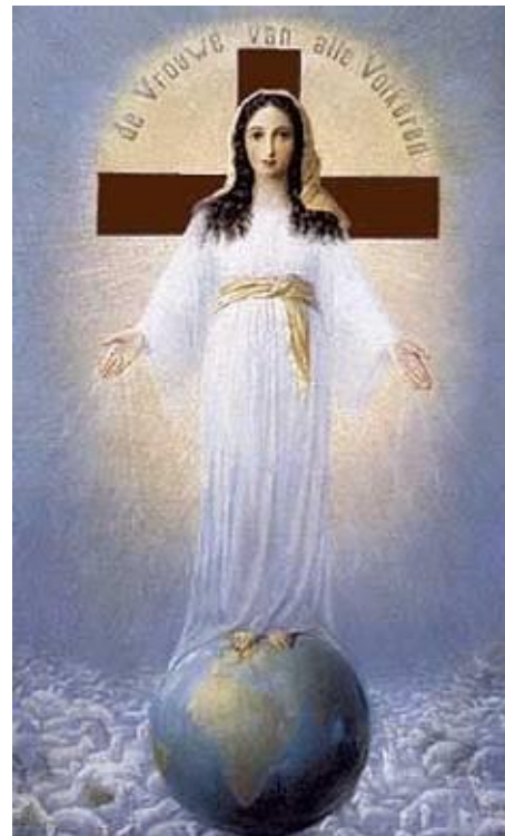
Die Frau Aller Völker, Siegelbringerin