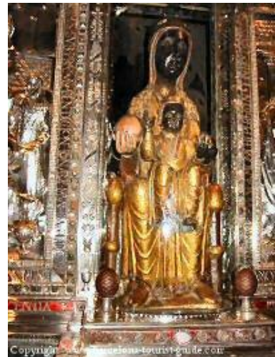
Madonna de Montserrat