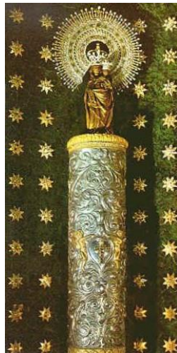
Madonna del Pilar