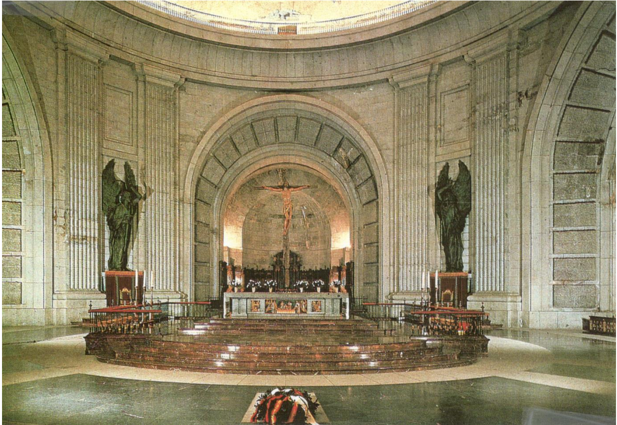
Grab von Francisco Franco im Heiligtum des Königspaares JESUS-MARIA im Tal der Gefallenen in Spanien