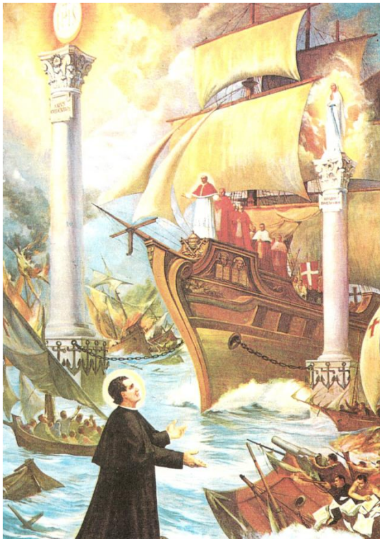
Die Verankerung der Heiligen Kirche zwischen den beiden Göttlichen Opferlammern.

O Allmächtiges Kaiserpaar Jahwe-Maria, Ihr habt Euren geliebten Sohn Giovanni Bosco zum Erzieher der Jugend erwählt. Schenkt uns das Feuer seines Herzens, damit wir mit demselben Eifer die Jugend zur Arche des Neuen Bundes führen, in die Heilige Marianische Kirche. Gloria! Alleluja! Hosanna! Sankt Amen.