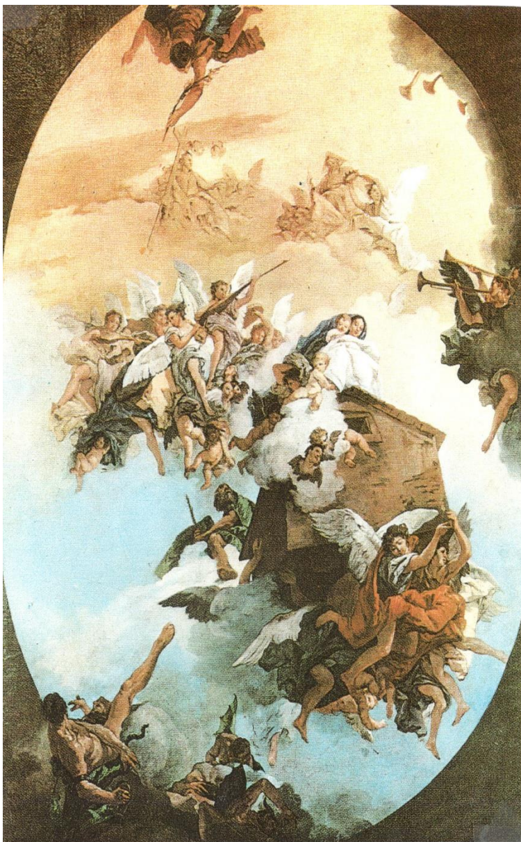
Übertragung des Heiligen Hauses durch die heiligen Engel nach Loreto Italien

Die Stadt Loreto befindet sich in Italien, an der adriatischen Küste, und kann mit den öffentlichen Verkehrsmitteln leicht erreicht werden. Auf diesem geheiligten Flecken Italiens steht das Heilige Haus von Nazareth, von Engeln wunderbar von Nazareth übertragen. Dieses Heilige Haus ist jene Wohnstätte, wo die Göttliche Jungfrau MARIA unbefleckt empfangen wurde und aufwuchs und wo das Wort Gottes Mensch wurde und ebenfalls aufwuchs. In diesem Haus wohnten auch Sankt Anna, Sankt Joachim und nach seiner Vermählung mit Maria auch der Heilige Josef. Der Tempel Gottes, bewacht von den unzähligen Engeln und verehrt von den grössten Heiligen der Kirche Jesu Christi. Die Übertragung des Heiligen Hauses fand am 10. Dezember 1294 von Dalmatien nach Loreto Italien statt.