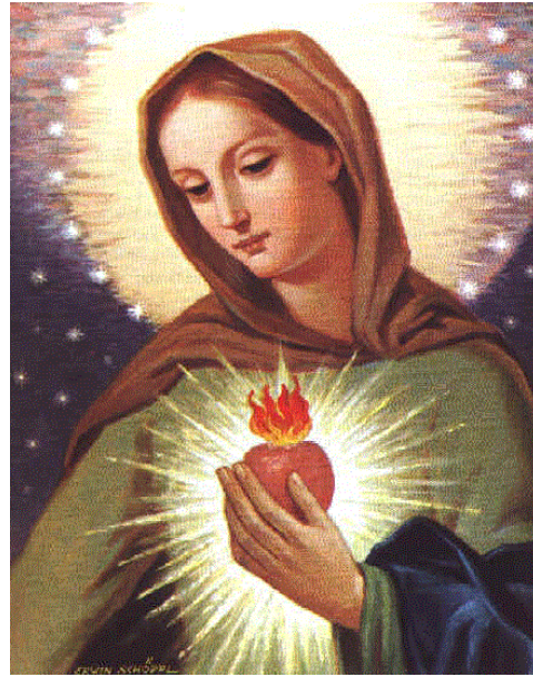
Unbeflecktes Herz Mariens

Die Geheimnisse des Erlöserlebens Christi, das wir im Laufe des Kirchenjahres feiern, gründen schliesslich alle in dem einen tiefen Geheimnis Seiner Liebe. Sie ist da vor Urbeginn alles Werdens; sie ist die schöpferische Kraft aller Gottestaten, wie Menschwerdung, Erlösungstod, Eucharistie, Gnade, Kirche. All diese Liebe stellt sich uns verkörpert dar im Herzen Jesu. In die Liebe, in das Innenleben dieses Herzens sich zu vertiefen, besonders aber diesem Herzen, das trotz Seiner Liebe soviel Undank erfährt, Sühne zu leisten, ist Sinn und Zweck der Herz-Jesu-Verehrung. Die Gedanken, die dem Herz-Jesu-Kulte zu Grunde liegen, wurzeln in der Heiligen Schrift. Heilige des christlichen Altertums wie Augustinus, des Mittelalters (Bernhard, Gertrud von Helfta, Mechthild) und der Neuere Zeit (Johannes Eudes, Margareta Alacoque, Mateo Crawley) halfen mit, Gehalt und Gestalt der Herz-Jesu-Verehrung zu schaffen. Papst Pius XI verlieh ihm einen Rang, der es unter die höchsten Herrenfeste einreicht.